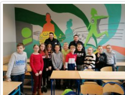
policjanci w szkole