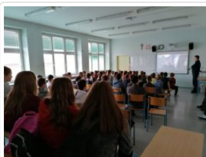
policjanci w szkole

Dopalacze to problem, który dotyka całe społeczeństwo. Innym poważnym problemem, z którym mogą spotkać się nie tylko dorośli ale również dzieci i młodzież, są zagrożenia wynikające z korzystania z internetu. Ta tematyka została także szczegółowo omówiona podczas wizyt w obu szkołach.